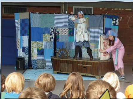
WHITE HORSE THEATRE